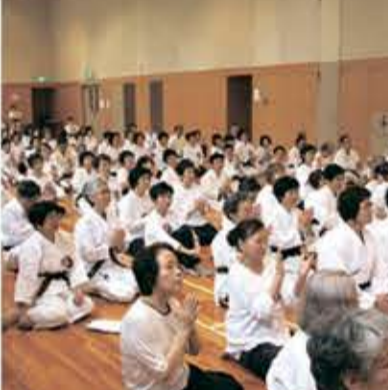
熱心にご講話を聞く参加者

さるそうです。更に私が強く感じたのは、楊麻紗先生の表情です。普段の稽古とは違って、言葉では表現できない不思議な雰囲気でした。楊麻紗先生の舞は、楊名時先生の理想とする「鶴の化身の如き品格」そのものに感じました。高橋裕子師範の閉会の辞、田村久夫師範の三本締めで「楊名時先生を偲ぶ交流大会」は無事終了しました。楊名時先生、皆様、ありがとうございました。