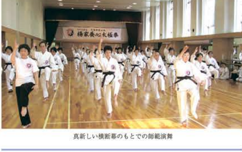
真新しい横断幕のもでの師範演舞