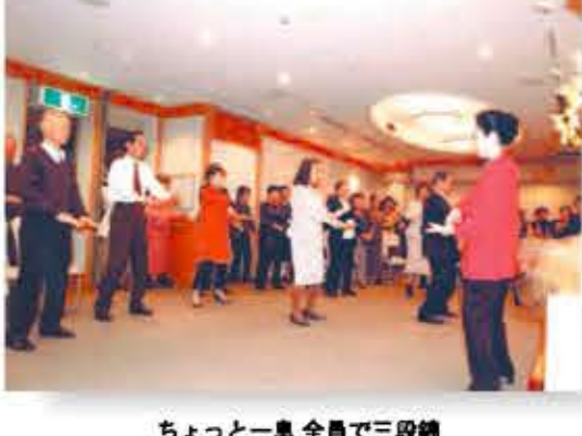
ちょっと一息 全員で三段鎖