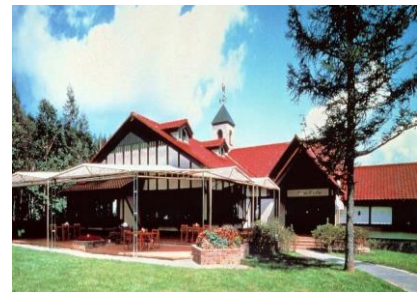
<八ヶ岳高原ロッジ泊>